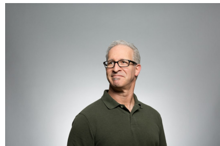
[Имя] Коммерческий представитель