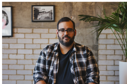
[Имя] Руководитель отдела маркетинга